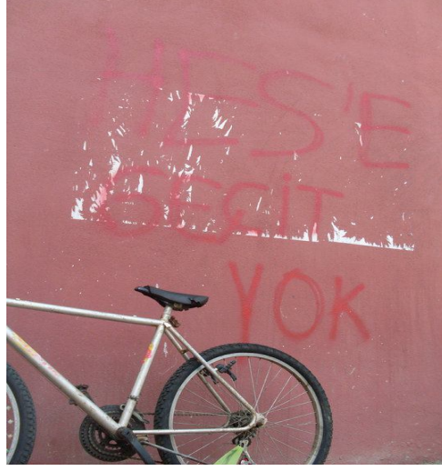
Şekil 2. Fındıklı HES Muhalefeti toplumsal hareketler repertuarından duvar yazısı örneği