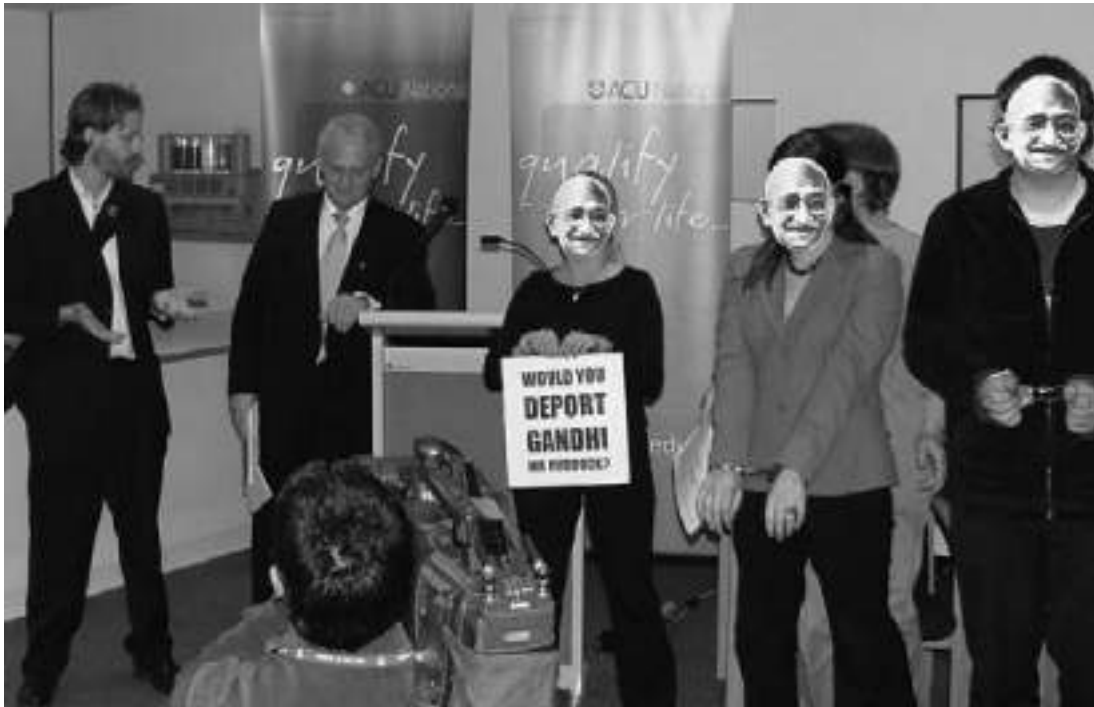
Scott Parkin'in tutuklanma ve sınır dışı edilmesine tepki gösteren protestocular.

Dürüstlüğünüzün kanıtı, performans ve bağlılığınız olacaktır. Destekçilerinizin, hakkınızda söyleyecekleri kritiktir. Samimiyetiniz ve iyi işler yaptığınıza dair bilgileri varsa ve sizin için açıkça bunları ifade ediyorlarsa bu değersizleştirme karşısında güçlü bir destek sağlar.