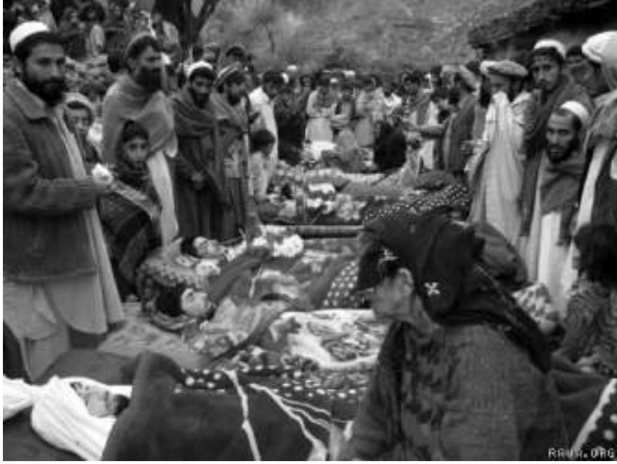
27 Aralık 2009'da Afganistan'ın Kunar Eyaletinin Narang bölgesinde Batılı askerlerin de dahil olduğu çatışmalar sırasında sekizi okul çağında çocuk olmak üzere 10 sivil öldürüldü.

Örneğin polis tarafından gerçekleştirilen şiddet eylemleri kamuoyu tarafından bilinmez. 12 Şiddet eylemine dâhil olan polisler bundan hiç kimseye bahsetmezler, belki yalnızca başka polislerle ama onlar da gizliliği korur. Şiddete maruz kalan kurbanlar ise utandıkları için ya da daha fazla şiddet görmekten korktukları için (bu gözdağı verme yönteminin bir sonucudur) kimseye söyleyemeyebilirler. Basın bu şiddetten haberdar olduğunda da haber yapmayabilir çünkü polisin bakış açısını benimsemiştir (bu da çerçevelemenin bir biçimi olarak yeniden yorumlatma taktiğidir). Polisin uyguladığı şiddete resmen bir sansür uygulanmasa da buna ilişkin bilgi çok sınırlıdır. Bu, fiili bir üstünü örtmedir ama birçok sürecin bir araya gelmesiyle oluşur.