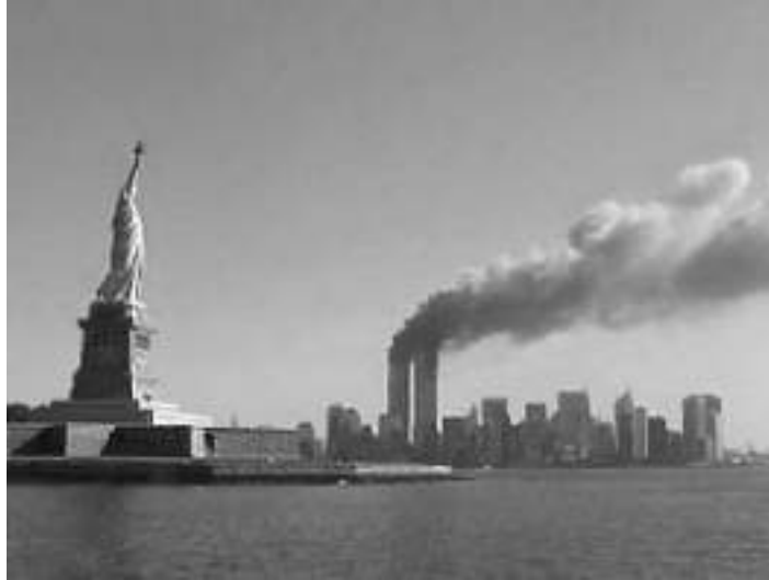
Dünya Ticaret Merkezi saldırısı, 11 Eylül 2001

Ders: Faillerin, her zaman, öfkeyi azaltmak için mümkün olan her yolu deneyeceklerini varsaymayın. Farkında olmaksızın veya bazen de kasten, tam aksi şekilde hareket ederler.