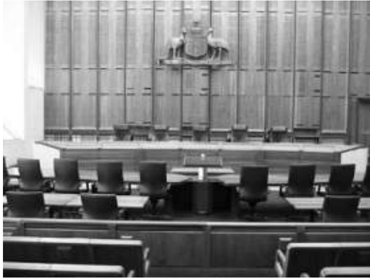
Avustralya Yüksek Mahkemesi

Eğer yönetici yanlış bir şeyi yaparken iş üstünde yakalanırsa diğerlerini suçlamaya çalışabilir. Bir olasılık imzayı atan diğer çalışanları suçlaması ve onların sorumlu olduğunu söylemesidir. Diğer olasılık, bu davranışlara olanak sağladığını iddia ettiği üst kademe yöneticileri suçlamasıdır. İşini kaybetmekle belgeyi imzalamak arasında kalan çalışanları suçlamanın adaletsiz olduğu düşünebilir ya da hepsini birden suçlamayı seçebilirsiniz. Diğerini suçlama taktiğine ses çıkarmayarak alınan risk, sorumluluğun azalması ve sonunda sadece birkaç günah keçisinin suçlu ilan edilmesine neden olmaktadır. Bu nedenle suçun doğru dağıtılması için gerekli bilgilere ve sürece hakim olduğunuza emin olmalısınız.