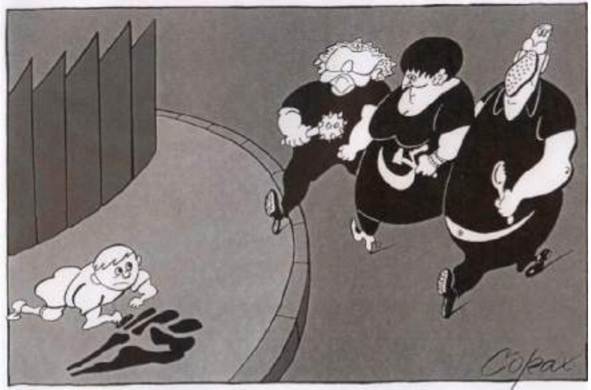
Otpor tarafından kullanılan, Corax tarafından çizilen karikatür.