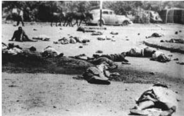
1960 yılında Güney Afrika'da ırkçı yasalara karşı tüm ülkede protestolar vardı. Sharpenville'de polis barışçıl protestoculara ateş açtı ve yaklaşık yüz kişi öldü. Polis ve hükümet, buna karşı oluşan öfkeyi düşürmeye çalıştı ancak bu katliam Güney Afrika hükümetinin itibarını uluslararası düzeyde ciddi biçimde zedeledi.

Geri tepme modeli saldırıları analiz etme yoludur. Adaletsiz olduğu düşünülen bir meseleyle ilgili öfkeyi artırmak ya da azaltmak için taraflarca atılan adımları ve eylemleri mercek altına alır.