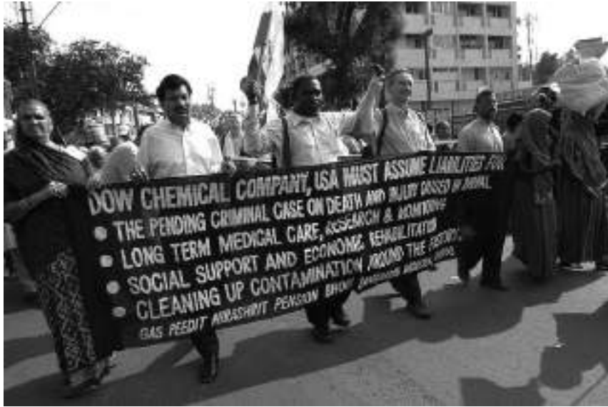
1984 yılında Hindistan'da bir kimya terminalinde yaşanan patlama binlerce kişiyi öldürdü yüzlercesini de yaraladı. Tesisin sahibi ABD merkezli Union Carbide firmasıydı ve toplumsal tepkiyi yok etmek için pek çok yol denediler.

muhtemelen bu kişiler aslında yaptıkları şeylerin doğru olduğuna inanırlar. Bunun sebebi de olayları farklı perspektiflerden görmeleridir.