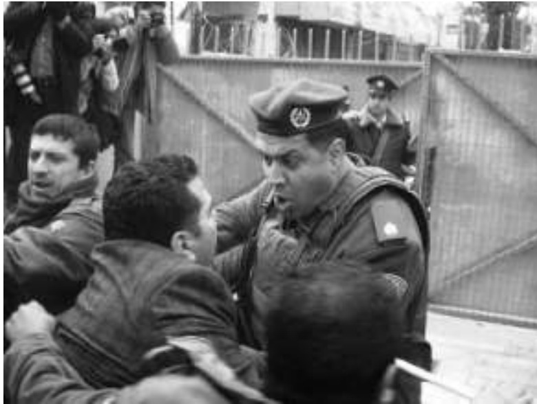
İsrail güçlerinin şiddet uygulayarak biber gazı ve ses bombalarıyla dağıttığı Hebron protestosu. Bir Alman dayanışma aktivisti göz altına alınırken.

İnsanları dövüyor veya onları vuruyorsanız o zaman kesinlikle siz de failsiniz. Başka insanlar sizi problemin kendisi olarak görecektir.