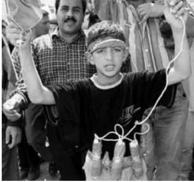
Teröristler genellikle toplumun tepkisini çeken eylemler düzenlerler.

Ders: Faillerin, her zaman, öfkeyi azaltmak için mümkün olan her yolu deneyeceklerini varsaymayın. Farkında olmaksızın veya bazen de kasten, tam aksi şekilde hareket ederler.