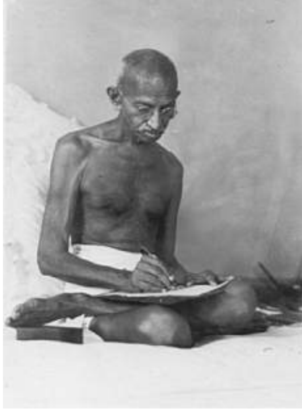
Mohandas Gandhi neredeyse her gün yazdı. Çalışmaları yıllardır basılıyor.