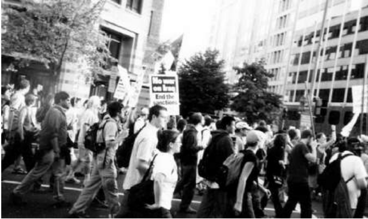
Irak ambargosu ve Irak işgaline karşı çıkan göstericiler, Washington, 2002 veya 2003 , Washington, DC.

onaylaması sağlanabilirdi. Bu da işgale çok daha büyük bir meşruiyet katarak ve başka işgallere kapı açabilirdi. 33