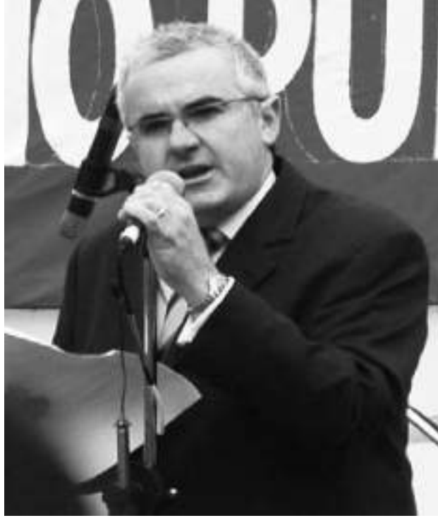
Andrew Wilkie, 2003 yılında Avustralya hükümetinin Irak işgaline dâhil olma konusundaki eylemleri hakkında konuşan bir istihbarat analisti. Avustralya hükümeti Wilkie'yi itibarsızlaştırmak için birçok teknik kullandı ama Wilkie etkin olarak hepsini etkisizleştirdi.

Hakkınızda söylentiler başlatabilirler. Düşük performansınız, cinsel davranışlarınız, sahtekârlıklarınız veya kişilik bozukluklarınız olduğu iddia edilebilir. Kişisel dosyalarınızı araştırabilir, itibarınızı zedeleyecek en küçük detayı bulmaya çalışabilirler. Belki 5 ya da 10 yıl önce birisi hakkınızda bir şikâyette bulunmuştur. Bu gibi şeyler abartılacak ve bir anda kamusallaştırılacaktır. Üzerinizde kurulan baskı nedeniyle dağılabilir, herhangi birisine buna bir son vermeleri için bağırabilirsiniz. O zaman da bu davranışınız normal dışı lanse edilecektir. İş-performans değerlendirmelerinizdeki en küçük olumsuzluklar dinleyen herkese abartılarak anlatılacaktır.