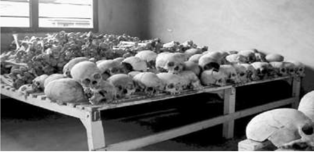
Katiller tarafından açılan derin kesikler Murambi okulunda bir odayı dolduran kafataslarında net biçimde görülüyor.

Bu gibi farklı görüşler varken geri tepme analizi nötr olamaz. Soykırım esnasında Ruanda hükümetinin kamuoyu tepkisini azaltmak için uyguladığı geri tepme taktiklerine 10 odaklanabilir ya da RFP'nin bazı üyelerinin şiddet içeren eylemlerini örtbas etmek için izlediği yöntemlere bakabilirsiniz. Ya da ikisini birden yapabilirsiniz. İkisini birden ele alsanız bile bir tarafın eylemlerine ilişkin bilgi diğerine kıyasla daha fazla olacağı için ya da bir tarafın eylemleri diğerine kıyasla belirgin şekilde daha zalim olduğu için 11 elinizdeki analiz her durumda dengesiz olacaktır.