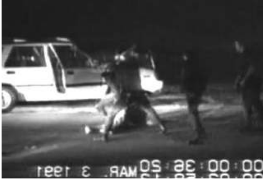
Rodney King'in dövülmesinin video görüntüleri

Çok fazla yazılı malzeme olduğu için röportaj yapmamaya karar verdim. Sonuçta muhabirler ve araştırmacılar tüm kilit kişilerle, bazıları oldukça derinlikli olacak şekilde konuşmuşlar ve yazıya dökmüşlerdi. Bu belgelerden faydalanabilirdim. Bazı kaynaklar arasında küçük detay farklılıkları vardı, bu nedenle bu noktalarda hangisini baz alacağıma karar vermem gerekti. 7