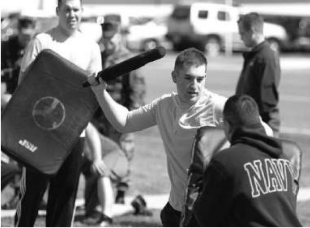
Elektroşok aleti. Hükümetler ve şirketler işkence yapmak, toplumsal öfkeyi azaltmak amacıyla çeşitli araçlar satıyorlar ve kullanıyorlar.

Bazen, bir polis konuşmak isteyebilir. Ancak bunu yapmak muhtemelen kariyerinin sonu olacaktır. Diğer bir seçenek de polis içinden bilgilerin sızmasıdır. Örneğin konuşma kayıtları, planların notları ya da sorgu kayıtları toplanabilir. Protestocular bilgi sızdıracak bir polis bulabilirse bu, tacizi ifşa etmek için güçlü bir yöntem olacaktır. Polisler içlerinden birinin bilgi sızdırdığından şüphelenilirse gizliliğe özen göstermeye ve daha dikkatli olmaya başlayabilir. Hatta potansiyel bilgi sızdıranlar için cadı avına yapabilir.