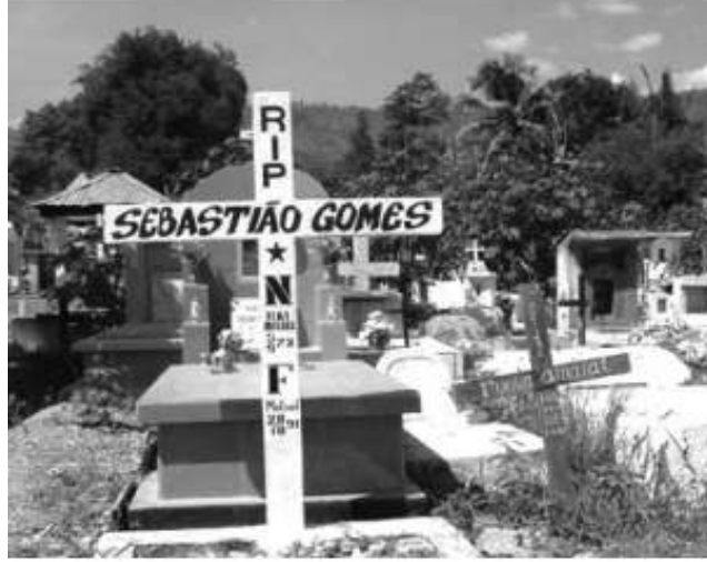
1991 yılında, Sebastiano Gomez'in mezarına doğru yürüyenerlere yapılan katliam.

Peki ne oluyor? Bazı saldırılar geri teperken neden bazıları geri tepmiyor?