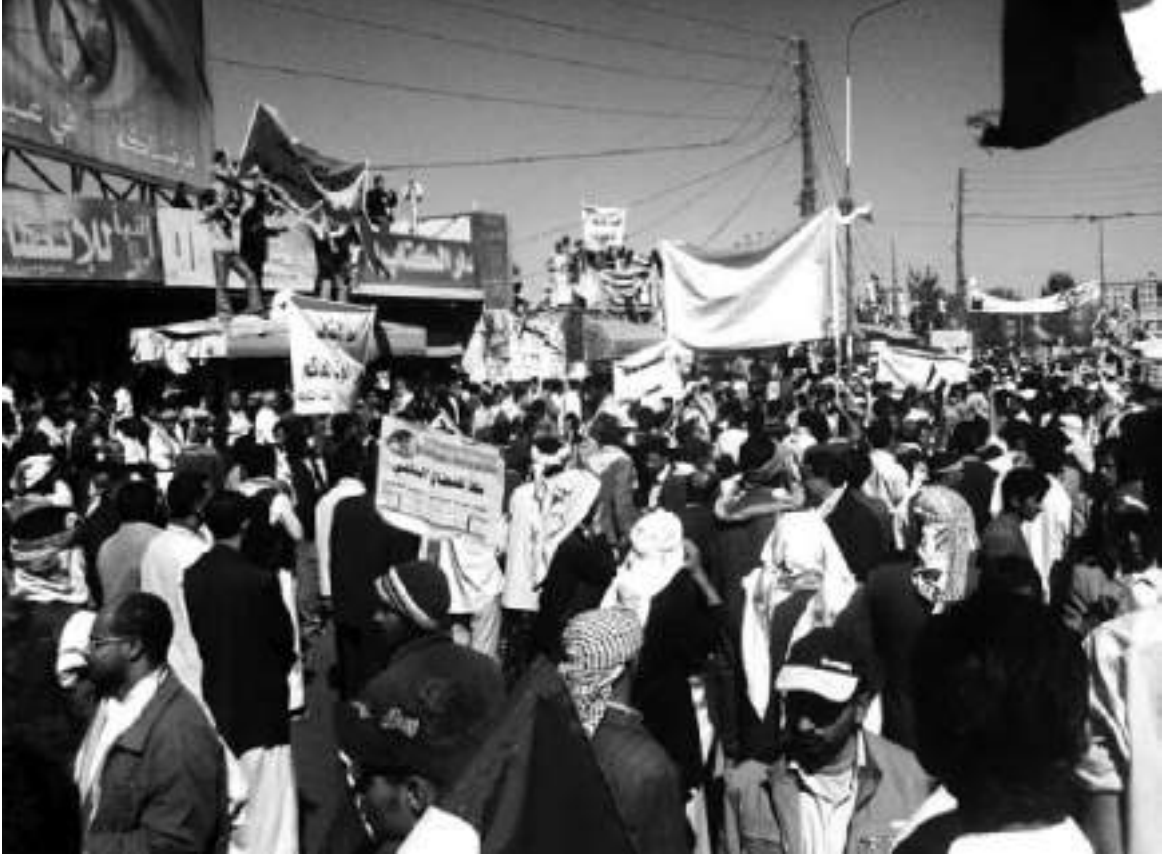
Sanaa protestoları, Yemen (3 Şubat 2011)

Gözdağına karşı hazırlanmanın bir diğer yolu da protestoya çok fazla sayıda insanın katılmasını sağlamaktır. İnsanlar bir grubun içinde hareket ederken daha güvende hisseder. Polisin geniş gruplara saldırma olasılığı küçük gruplara kıyasla daha düşüktür. Daha fazla katılım nasıl sağlanabilir? Standart yöntem daha çekici bir eylem planı sunarak daha fazla insanı çekmektir. Polis şiddetine duyulan korku önemli bir faktörse, riskleri azaltacak bir yer, zaman ve yaklaşım seçmek önemlidir. Örneğin protestoya katılmayan pek çok kişinin olduğu uygun bir yer.